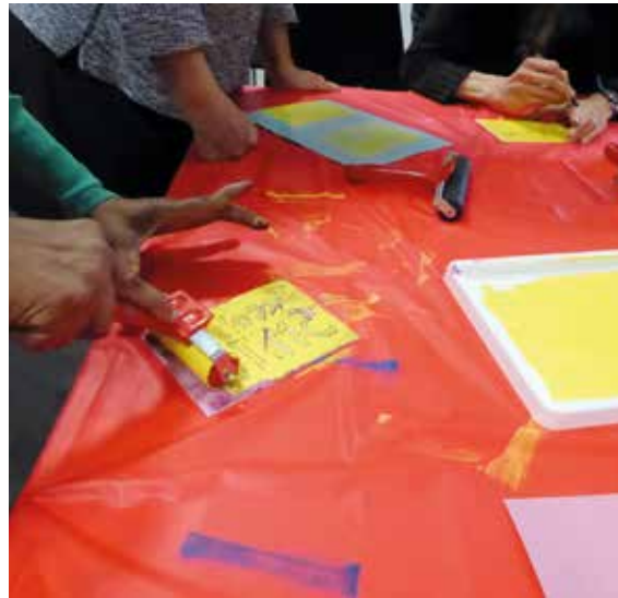
Die Greater Manchester Combined Authority verschickte 16.000 Kreativpakete während der Pandemie.

britischen Regierung aus dem Jahr 2018 beruht vor allem auf der Teilhabe an Kultur und Kreativität sowie auf »social prescribing« (vgl. Department for Digital, Culture, Media and Sport 2018). Als Reaktion auf den durch die Pandemie verursachten Anstieg der Isolation hat das Ministerium für Kultur, Medien und Sport nun ein Netzwerk zur Bekämpfung der Einsamkeit eingerichtet, das Kunst- und Kulturschaffende mit kommunalen und weiteren öffentlichen Anbietern zusammenbringt. Bleibt zu hoffen, dass das Netzwerk mit der Cultural Recovery Taskforce (der staatlichen Nothilfe für den Kultursektor in Zeiten von Covid-19) der Regierung zusammenarbeiten wird, damit sichergestellt ist, dass der Zusammenhang zwischen Kultur, sozialer Isolation und Gesundheit in die politischen Entscheidungen der kommenden maßgeblichen Monate einfließt. Da Großbritannien die schlimmste Rezession in ganz Europa bevorsteht, ist es wichtig, regierungsübergreifend in Zusammenhängen zu denken, um die psychische Gesundheit von Menschen aller Altersgruppen zu unterstützen.