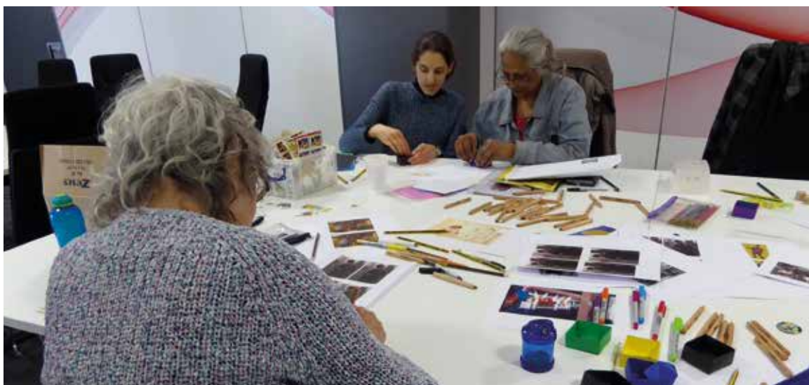
Kunstgeragogik im Londoner Postmuseum

Diese reichten von großen Projekten – wie das der Greater Manchester Combined Authority, die 16.000 Kreativpakete an ältere Menschen ohne digitalen Zugang verschickt hat – bis hin zu kleinen, fokussierten Projekten – wie »Smile Inside« von Inclusive Intergenerational Dance. Das Projekt möchte isolierte ältere Menschen, freie Künstlerinnen und Künstler und Menschen aus dem Wohnumfeld miteinander in Kontakt bringen: Die Älteren werden gebeten zu erzählen, was sie innerlich zum Lächeln bringt, während die beteiligten Künstlerinnen und Künstler und Menschen aus der Nachbarschaft die Geschichten vorlesen und darauf in Briefen antworten, um wiederum den ursprünglichen Geschichten-erzählerinnen und -erzählern »ein Lächeln ins Gesicht zu zaubern«. »Es hat mir große Freude gemacht zu wissen, dass Sie mir zugehört haben«, resümierte ein Geschichtenerzähler.