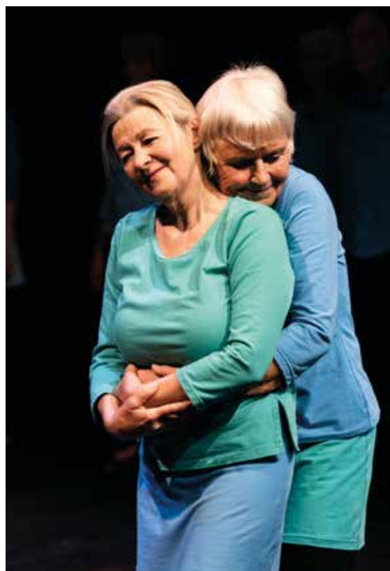
Sehnsucht nach körperlicher Nähe statt Leben auf Distanz

Im Rückblick fasst einer der Tänzer, der seit der ersten Produktion zur Company gehört, die intensiven Erfahrungen bei der Entwicklung eines Stücks, das Erleben von gegenseitigem Vertrauen und die Magie der Vorstellungen übrigens