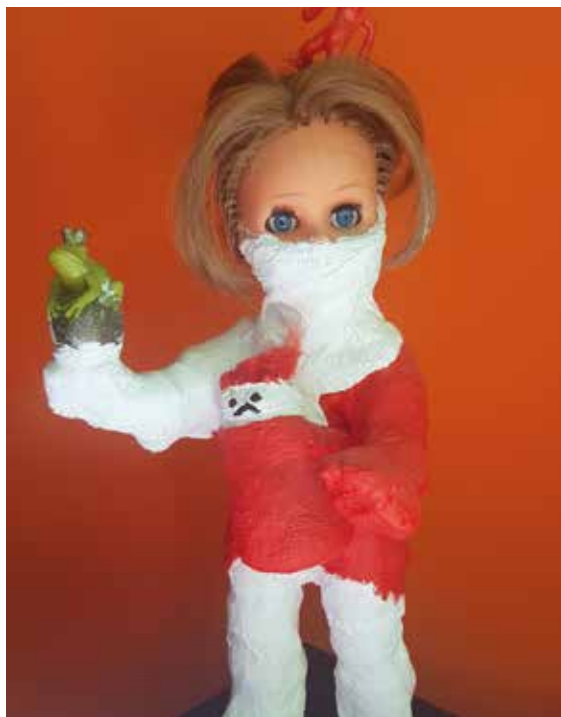
Masketragen ist das Gebot der Stunde im Werk von Martina Raguse.

Nach zwei Präsenzsitzungen im Südbahnhof kam der Lockdown. Hieß es im Online-Aufruf zur Teilnahme an der ersten Sitzung im Februar: »Wir wollen persönliche Räume der Einsamkeit gestalten, ihr durch Texte, Farben, Körperlichkeit einen Ausdruck geben«, so wurde der Rückzug in die persönlichen Räume nun zu einer Realität, die sich alle Beteiligten vorher in dieser Radikalität nie hätten vorstellen können.