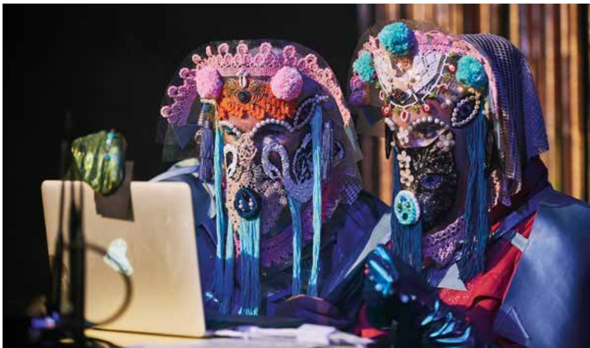
Pirana und Elektri sprechen bei »Damengedeck 2.0« zu uns aus der Zukunft.

gespielt wird«, sagt Netta. Solche Bildungsangebote waren nun nicht mehr möglich. Trotzdem zeigte sich während der Konzerte, wie wichtig die Pflegenden für den Bau der musikalischen Brücken sind: Sie bringen die Bewohnerinnen und Bewohner zu ihren Sitzplätzen auf den Balkonen und an den Fenstern, verteilen Corona-Regenbogenfähnchen, die von den Seniorinnen und Senioren alsbald eifrig im Takt der Musik geschwungen werden. Auf dem Balkon tanzt ein Pfleger mit einer Bewohnerin einen langsamen Walzer. Die Pflegekräfte unterstützen die leibliche Resonanz der Bewohnerinnen und Bewohner auf die Musik, dienen gleichzeitig als Verstärker und Übersetzer.