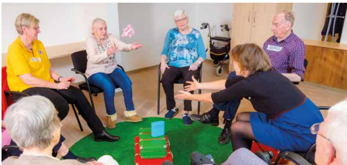
Im Stuhlkreis der Theatergruppe fliegt Stoffschwein Olga durch die Luft.

Jahren. Neben den Teilnehmenden selbst waren an den Einheiten lediglich eine Demenz- bzw. gerontopsychiatrische Fachkraft und die wissenschaftlichen Mitarbeiterinnen des Projektteams beteiligt (vgl. ebd.).