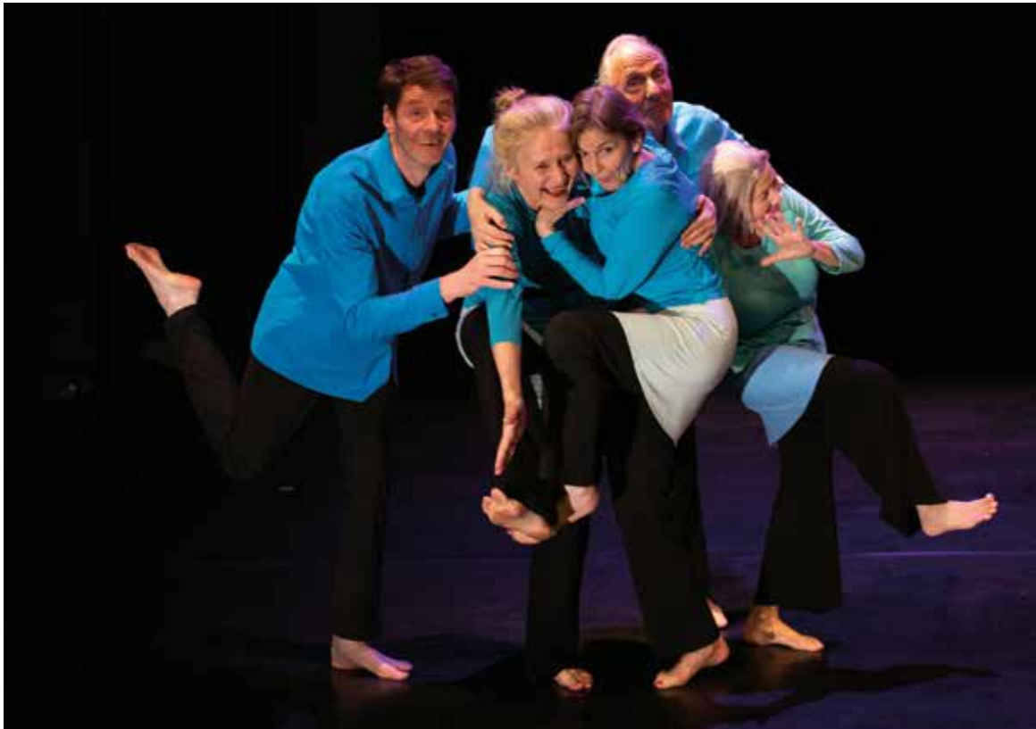
Fragiles Gleichgewicht braucht gegenseitige Unterstützung.

Berührende Szenen gibt es, wenn es um die Auseinandersetzung mit dem alternden Körper geht, der mal hier, mal dort nicht mehr so funktioniert, nicht so perfekt ist, wie man es bisher gewohnt war. Lautstark in Stimmen und Bewegungen kommt die Unzufriedenheit darüber zum Ausdruck, doch plötzlich wandelt sich die Szene, wenn die Tanzenden beginnen, mit zarten Gesten ihre Körper zu berühren und die Bewegungen an Leichtigkeit gewinnen. Vielleicht ist es die Entdeckung dessen, was eine jede und ein jeder an sich schätzt?