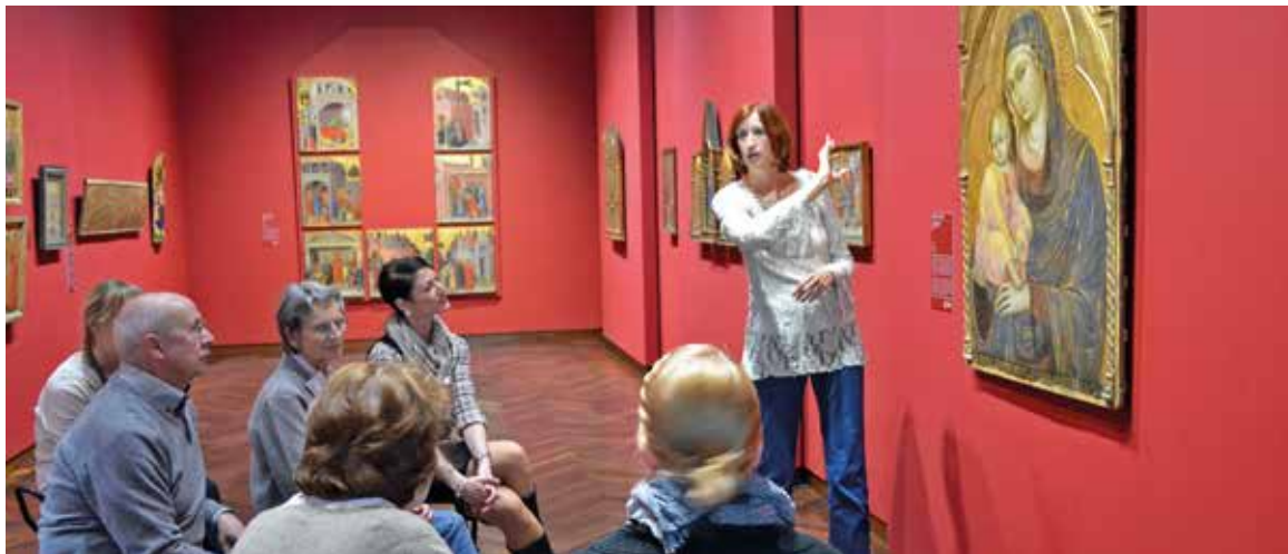
Kunstbegegnung für Menschen mit Demenz im Frankfurter Städel-Museum zum Thema »Familie und Kinder«

bereits weit verbreitet (vgl. Ganß / Kastner / Sinapius 2016). Museen vernetzen sich untereinander (zum Beispiel die Ruhrkunstmuseen), schulen sich gegenseitig und tauschen Erkenntnisse und Konzepte aus, um den Museumsraum und seine Objekte für Menschen, die mit einer Demenz leben, erfahrbar zu machen.