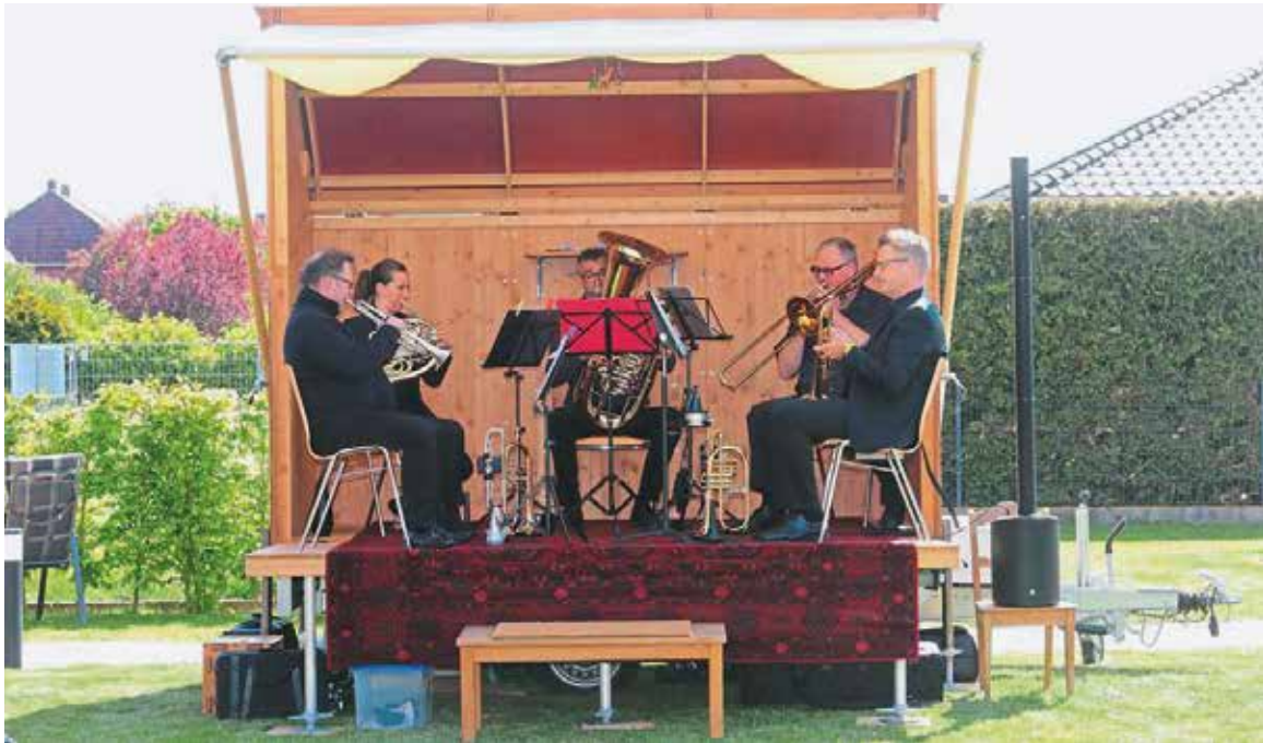
Große Musik auf kleiner Bühne: Das Nordwestblech-Quintett spielt vor dem Seniorenzentrum Drüke-Löhne.

Menschen steht und auf der anderen deren Freiheitsrechte gefährdet sind, Kulturteilhabe und kulturelle Inklusion trotz räumlicher Distanz ermöglicht werden? Was geschieht mit dem die kulturelle Bildung (nicht nur) im Alter leitenden Anspruch der Partizipation in einer Situation, in der räumliche Distanz und Hygienebestimmungen zur notwendigen Bedingung werden? Wie reagieren Projekte kultureller Altersbildung auf das Re-Mapping des Alters und die Neupositionierung der Generationen im soziokulturellen Raum?